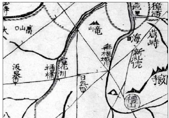
『동여도』(18첩 5면) 동진강 일대

전라북도 부안지방에서 부르던 명칭의 하나이다. 『신증동국여지승람』(부안)에는 통진을 '통진'이라 부른다고도 하였다. 벽골제와 놀제의 두 물이 흘러 이 나루가 된다고 하였다. '통진'은 황해로 통하는 나루터를 뜻하는 이름으로 풀이된다. 🌊