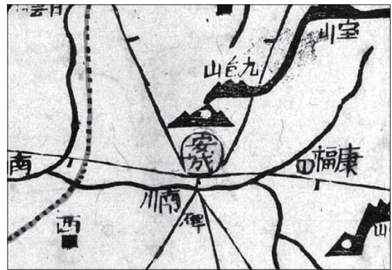
『대동여지도』 (14천 5면) 안성천(남천) 일대

직산현 흥경원 북쪽에 와서 이 냇물이 된다. 또 수원부 오을미곶에 들어간다."라는 기사 내용이 있다. 이 지명은 안성천이 경기도 용인시 처인구 원삼면 고당리에서 발원하여 남쪽으로 흐르는 한천과 만나 흐르는 하류를 지칭하는 부분칭으로 보인다. 🌊